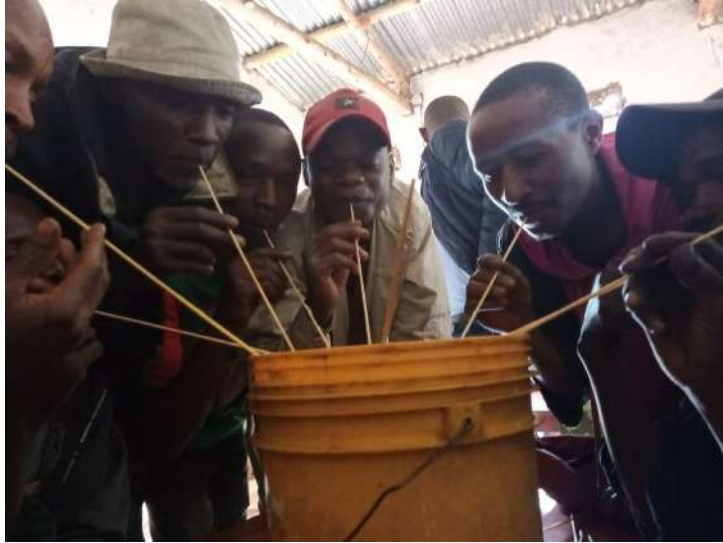
Partage de la bière locale à base d'éleusine