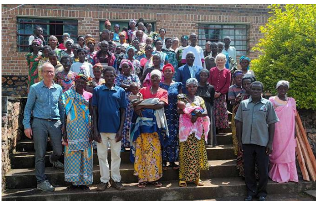
Une partie des bénéficiaires à GIHETA