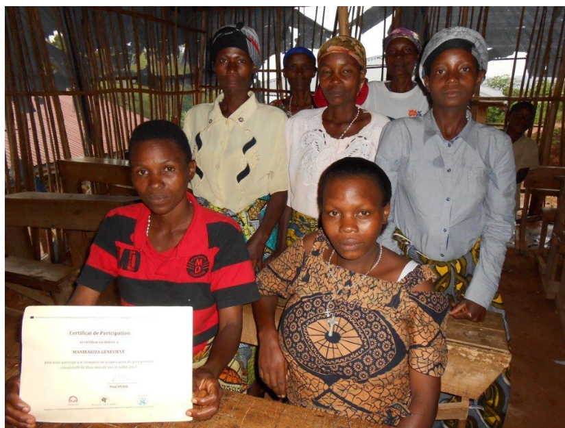
Les boulangères dans l'école du village

Lors de sa visite d'Octobre Didier a pu vérifier que le four était quasiment achevé, ainsi la boulangerie devrait être opérationnelle avant la fin de l'année.